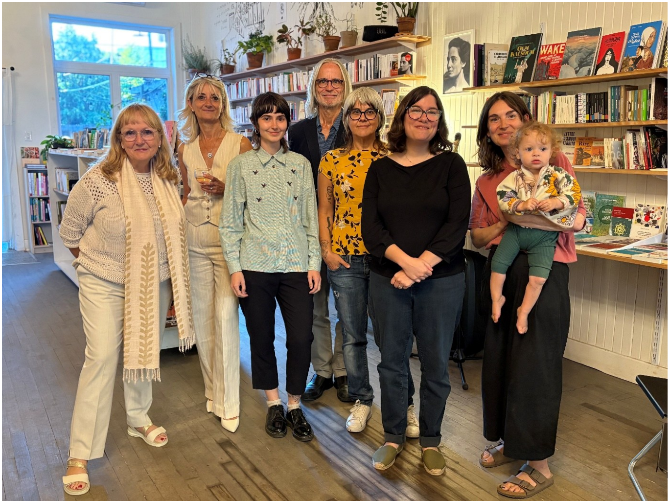
Personnes présentes lors du lancement du numéro thématique « Interpréter, créer et subvertir les textes religieux » de la revue Recherches Féministes