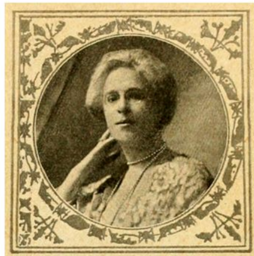
Inconnu, 1917. Wikipedia Commons

des femmes à cette université, qui jusque-là n'acceptait que les hommes. Celui-ci refuse pour des raisons financières, mais, coup de théâtre, l'homme d'affaires Donald A. Smith (futur Lord Strathcona) donne 50 000 $ pour l'éducation des filles à McGill en 1884. C'est en son hommage que ces premières étudiantes à McGill ont été surnommées les « Donaldas » iii .